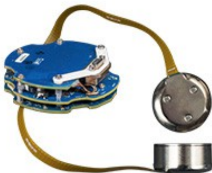
wersja bez obudowy