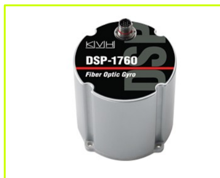
wersja w obudowie