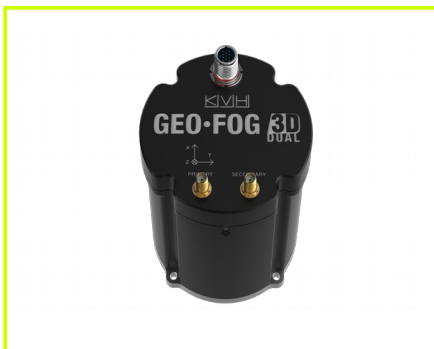
wersja z 2-ma antenami GPS

czas realizacji zamówienia: prosimy o kontakt gwarancja: 12 m-cy